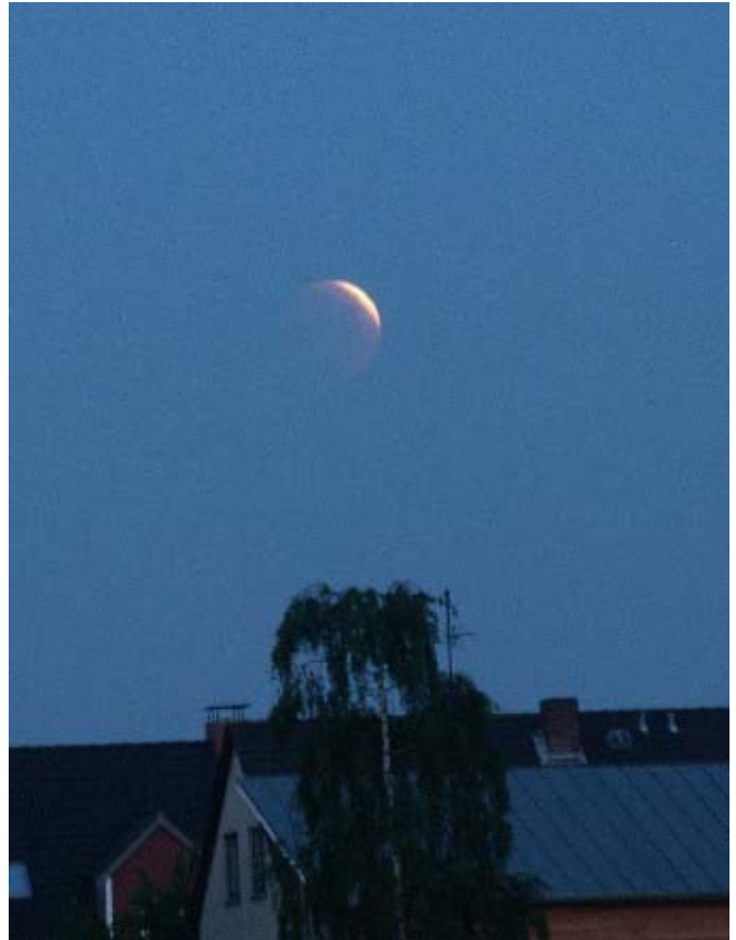
Abb. 2: Kurz vor Beginn der Totalität.

Um diese Nachtzeit dauert die Fahrt zum Messdorfer Feld nur wenige Minuten. Außer einigen Heimkehrern von einer Studentenfete in der PF-Mensa ist niemand unterwegs. Etwas erstaunt bemerken wir bei einem Getränkehandel geschäftige Betriebsamkeit. Dann erinnere ich mich daran, dass dies ja der Lieferant der Mensa-Feten ist; er bringt gerade seine leeren Fässer zurück. Während der Fahrt fällt auf, wie rasch es jetzt heller wird; die bürgerliche Dämmerung beginnt. Am Messdorfer Feld sind wir nicht die ersten. Ein älterer Herr hat ein Stativ aufgebaut und fertigt Serienaufnahmen der MoFi an. Fast scheint es, dass er etwas verärgert ist, dass nun andere Leute hier sind. Während ich die Kamera auspacke, kommt aus dem benachbarten Steinweg noch ein jüngerer Mann mit Zeitung unter dem Arm. Er geht ein Stück den Feldweg hinunter, kehrt dann aber um - die Mondfinsternis ist wohl doch nicht so seine Sache. Dabei bietet die noch verbliebene Sichel am blauen Himmel über ein paar Gärten einen überaus reizvollen Anblick, wie das nachfolgende Bild zeigt.