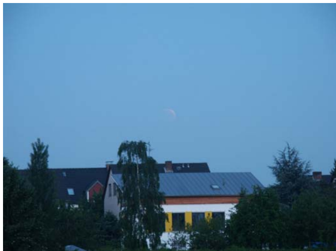
Abb. 3: Eins der letzten Fotos, unmittelbar nach Beginn der Totalität.