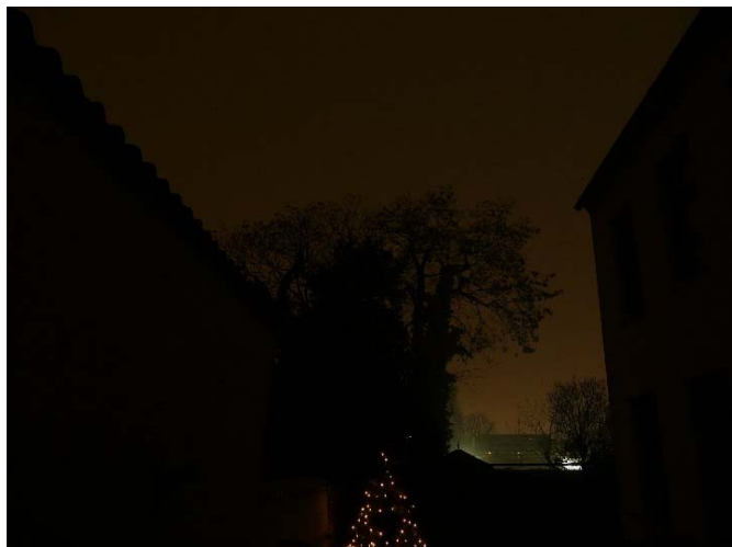
Abb. 2: Blick in den Nachthimmel am 31.12.2009 um 19:28 Uhr. Die Wolken sind durch die Beleuchtung der Bonner Innenstadt stark aufgeleuchtet.