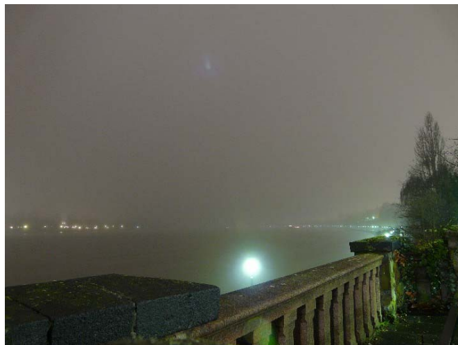
Abb. 3: Blick vom Bonner Rheinufer über den Fluss auf den rechtsrheinischen Stadtteil BEUEL-SÜD, aufgenommen am 31.12.2009 um 20:34 Uhr. Oberhalb der Bildmitte ist ein Reflex zusehen, der von der Lampe unten im Bild in der Optik der Kamera erzeugt wird.

Ich gehe noch einmal zum Rheinufer, da es zumindest nicht mehr regnet. Inzwischen ist es dafür etwas neblig geworden; ich kann den etwa 1500m entfernten Posttower allenfalls erahnen. Trotzdem dauert der Aufenthalt am Rheinufer ein paar Minuten länger als beim ersten Mal, weil ich ein paar Fotos mache, eine Feuerwerksbatterie abfeue und davon ein Video drehe. So habe ich wenigstens ein paar Bilder für meinen Livebericht.